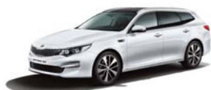
Snow White Pearl